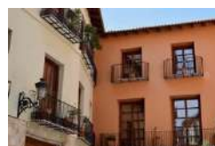
Das Haus – gemütlich sein