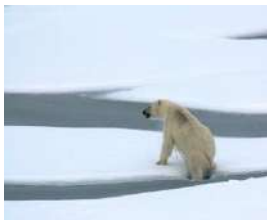
Der Arktische Ozean – kalt sein