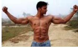
Raj - stark sein